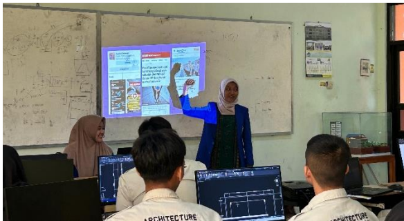
Gambar 2. Foto Kegiatan