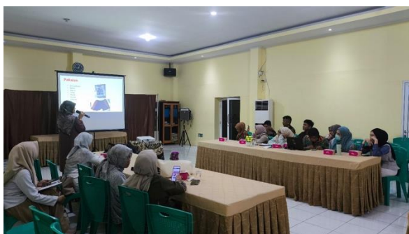
Gambar 2. Dokumentasi Kegiatan 1

Pendekatan pelaksanaan kegiatan tidak hanya berupa ceramah satu arah, tetapi juga dilengkapi dengan diskusi interaktif dan pembahasan kasus yang sering ditemui dalam praktik sehari-hari. Metode ini memungkinkan peserta untuk mengaitkan materi yang disampaikan dengan pengalaman klinis mereka, sehingga solusi yang diberikan bersifat aplikatif dan kontekstual. Respon peserta selama kegiatan menunjukkan tingkat keterlibatan yang baik, tercermin dari keaktifan dalam sesi diskusi dan tanya jawab.