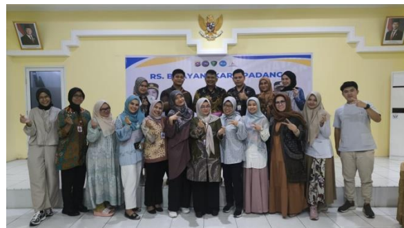
Gambar 3. Dokumentasi Kegiatan 2

tanggung jawab hukum dan etik dokter dalam penulisan VeR. Temuan ini mendukung pendapat bahwa intervensi edukatif singkat dapat meningkatkan kesadaran dan pengetahuan dasar tenaga medis terhadap aspek medikolegal yang jarang diperoleh secara mendalam dalam praktik klinis rutin. 1,2