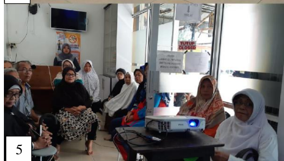
Gambar 1-5. Dokumentasi Kegiatan