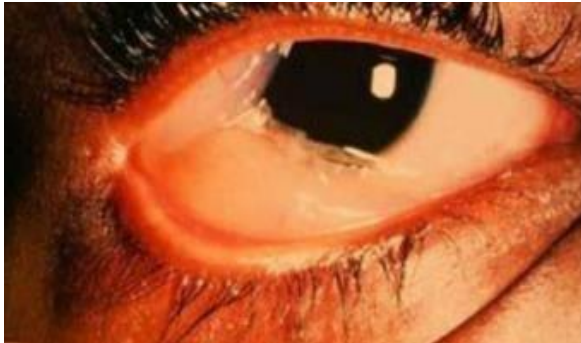
Gambar 2.4 Kemosis Konjungtiva